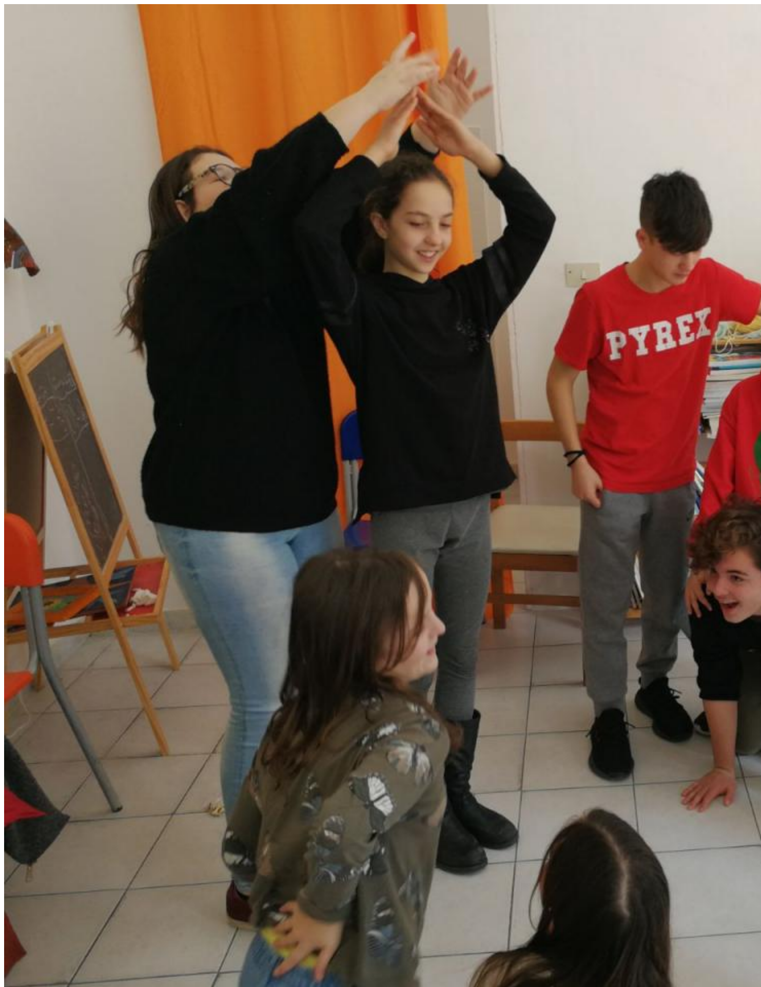
Martedì 27 marzo le classi II E e II F della Staffetti e le classi I C e II C della Malaspina hanno vissuto un'esperienza davvero emozionante: un laboratorio teatrale in lingua inglese ,