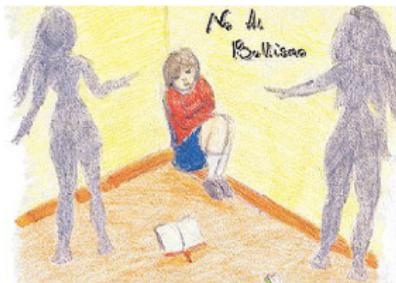
VIOLENZA La violenza non è solo fisica ma anche psicologica

«Mi prendevano in giro perché provenivo da un paese straniero e parlavo male la loro lingua. E a loro questa cosa dava fastidio o forse mi infastidivano solo perché