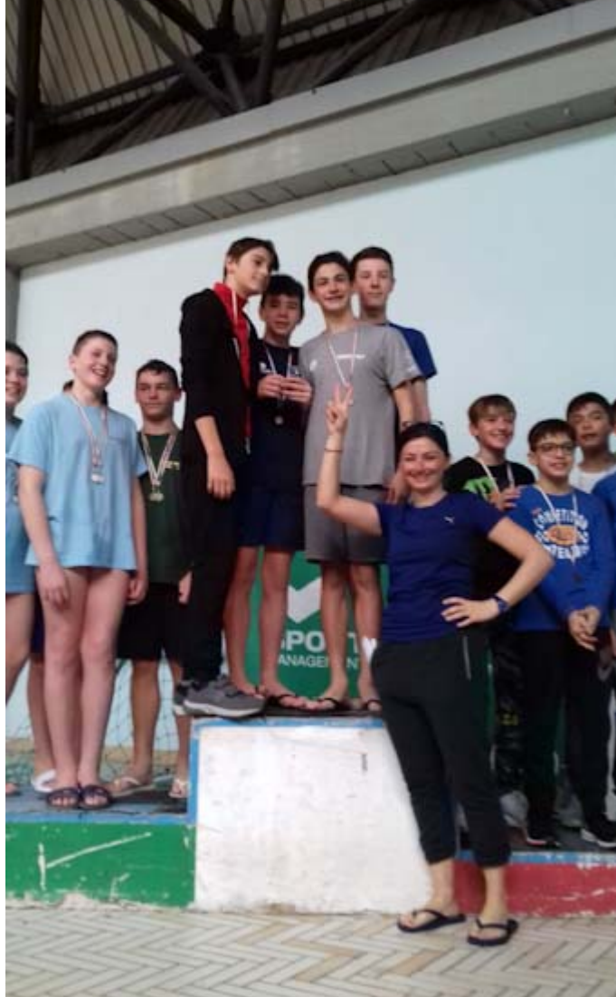
Si conclude con la vittoria della squadra

maschile Malaspina-Staffetti la finale provinciale di nuoto delle scuole secondarie di primo grado che si è svolta il 17 aprile presso la piscina comunale di Massa .