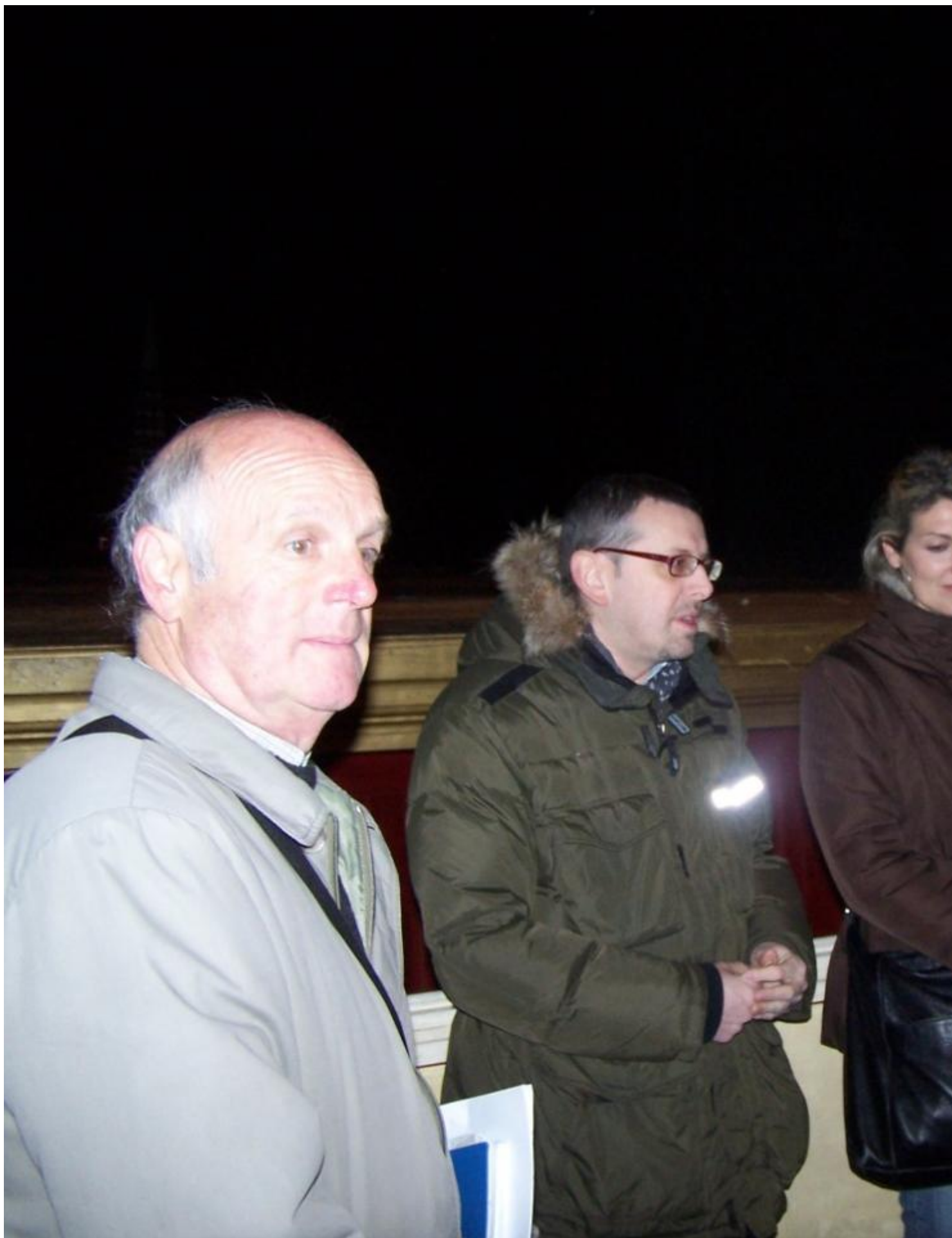
Il giorno 20 febbraio 2014 le classi III A, III C, III D, III E e II C del plesso Malaspina hanno