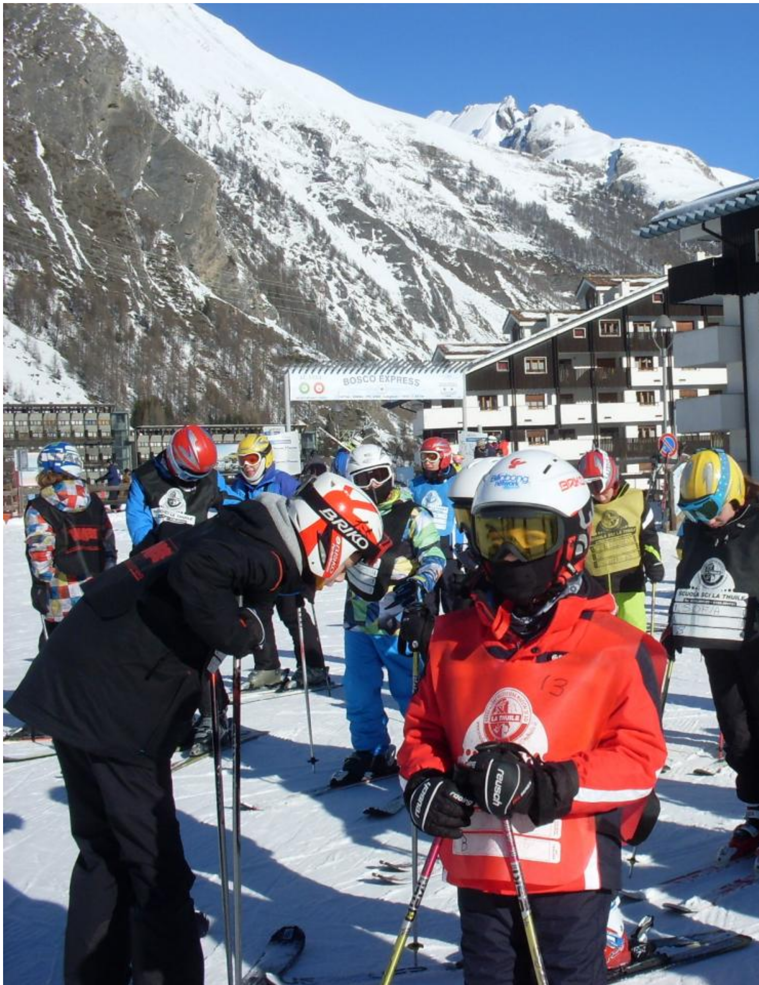
Dal 22 al 28 febbraio 2015 il nostro Istituto, come ormai avviene da più di 15 anni, ha