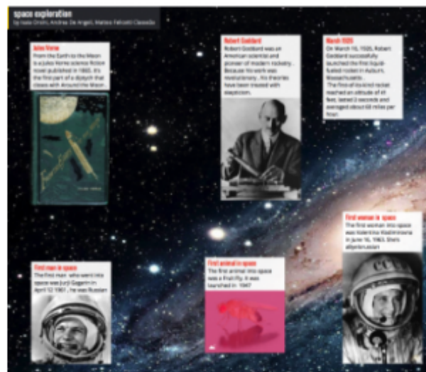
Figura 6 – Padlet realizzato da alcuni allievi della Malaspina 5 .

La straordinaria versatilità del Padlet ha fatto sì che in tanti ne sperimentassero l'uso all'interno di classi. Si evince dalla segnalazione reperibile in rete dell'uso della webapp da parte di un gruppo di allievi della scuola Malaspina che hanno realizzato come task una webquest sull'esplorazione spaziale con successiva condivisione del lavoro predisposta all'uso.