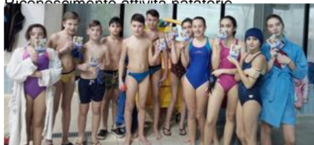
Gli studenti del Centro Sportivo Studentesco