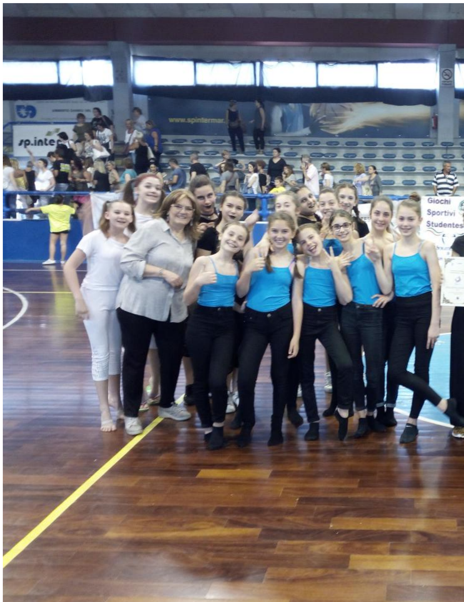
Stamani le tre rappresentative della Malaspina Staffetti che avevano guadagnato i primi tre posti nelle selezioni di istituto della Gymnaestrada , hanno portato le loro coreografie alla