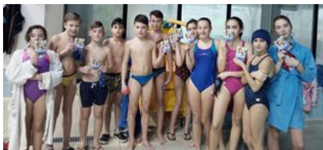
Gli studenti del Centro Sportivo Studentesco