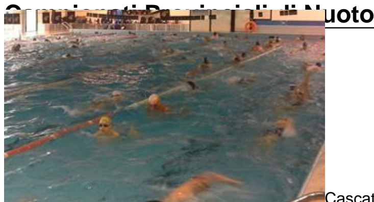
Cascata di medaglie per gli alunni della Malaspina

Inviato da admin il Mer, 18/04/2018 - 07:00