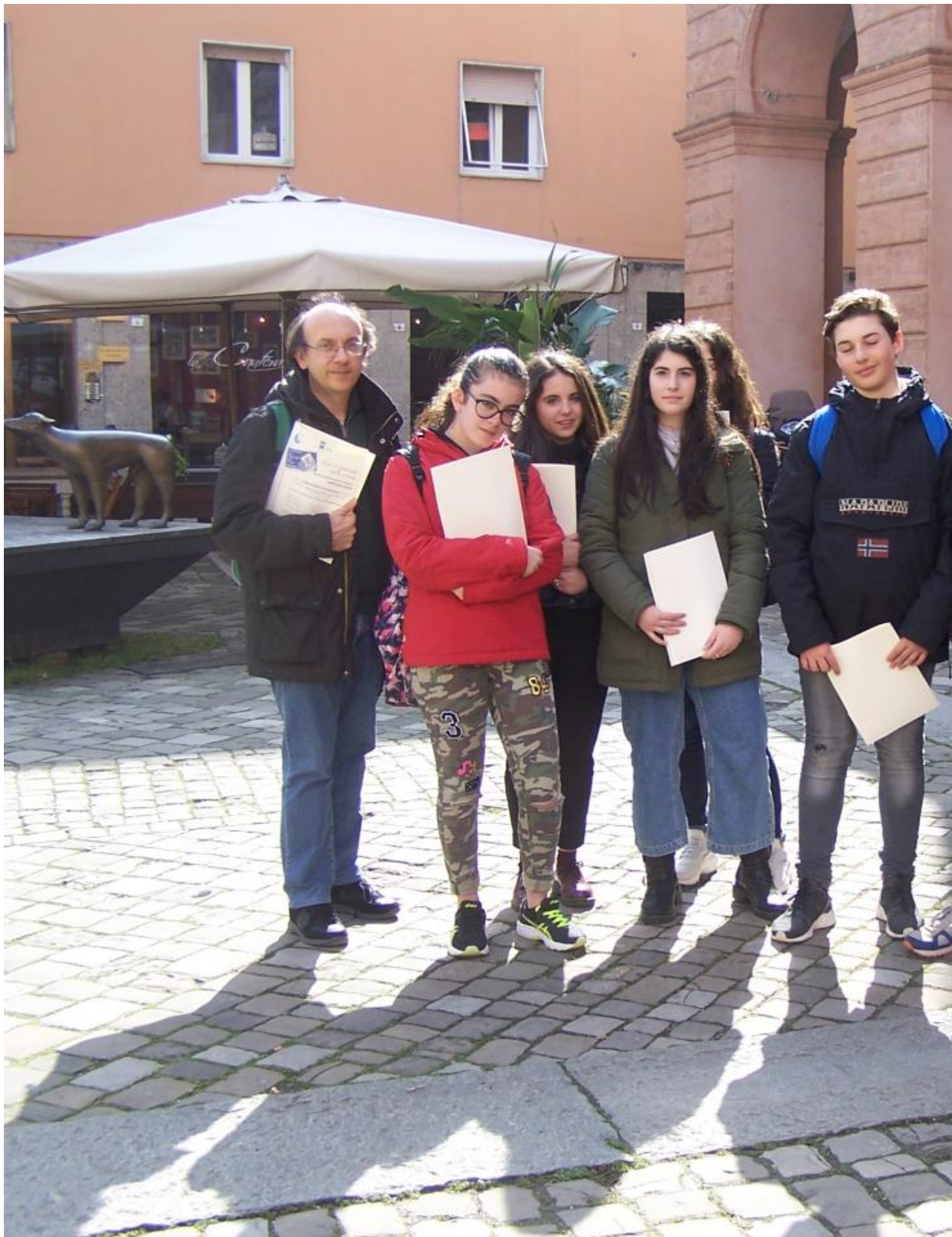
Nuovo bellissimo riconoscimento per il giornalino della nostra scuola.