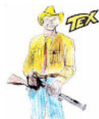
HITO Made Gabriele Cantoni

COME passano il loro tempo libero i nostri concittadini? Quali fumetti leggono? Con quali videogiochi trascorrono il loro tempo libero? Per avere le risposte abbiamo intervistato alcuni edicolanti e alcuni negozianti del centro della città. Parlando con il giovane esercente di «Comics World», un angolo di cultura nerd in via Cavour, è emerso che il manga (i fumetti giapponesi) vanno a ruba tra chi ha meno di trent'anni: un albo che racconta la storia dei pirati alla ricerca del favoloso tesoro che prende il nome di "One Piece" vende ad ogni uscita in media sessanta copie, mentre le avventure del ninja "Naruto" si attestano su circa cinquanta e le storie degli shinigami della serie "Bleach" arrivano a circa trenta copie. Secondo gli edicolanti di via Guidoni e di piazza Gagliardini, l'unico fumetto