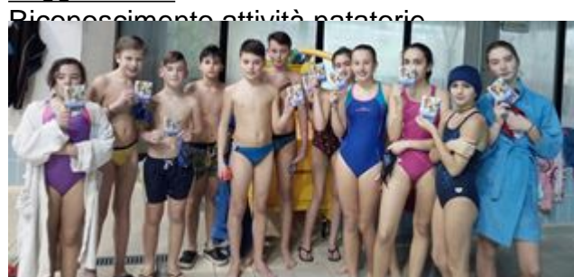
Gli studenti del Centro Sportivo Studentesco