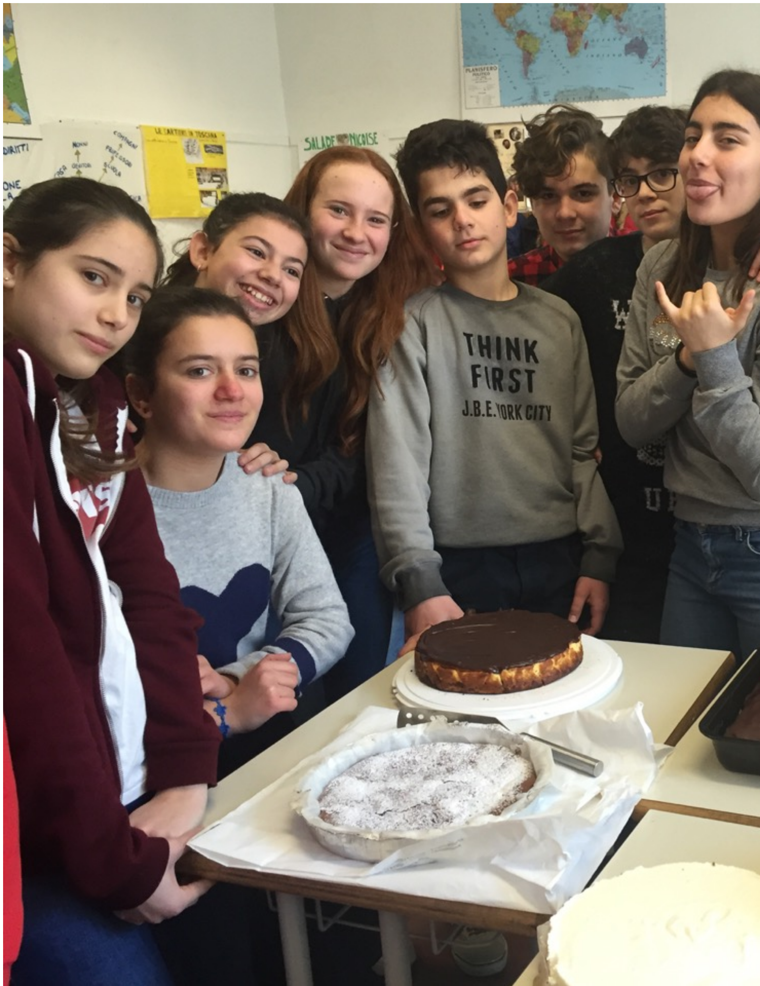
Cibi sani, una dieta bilanciata ed una corretta educazione alimentare promuovono il benessere