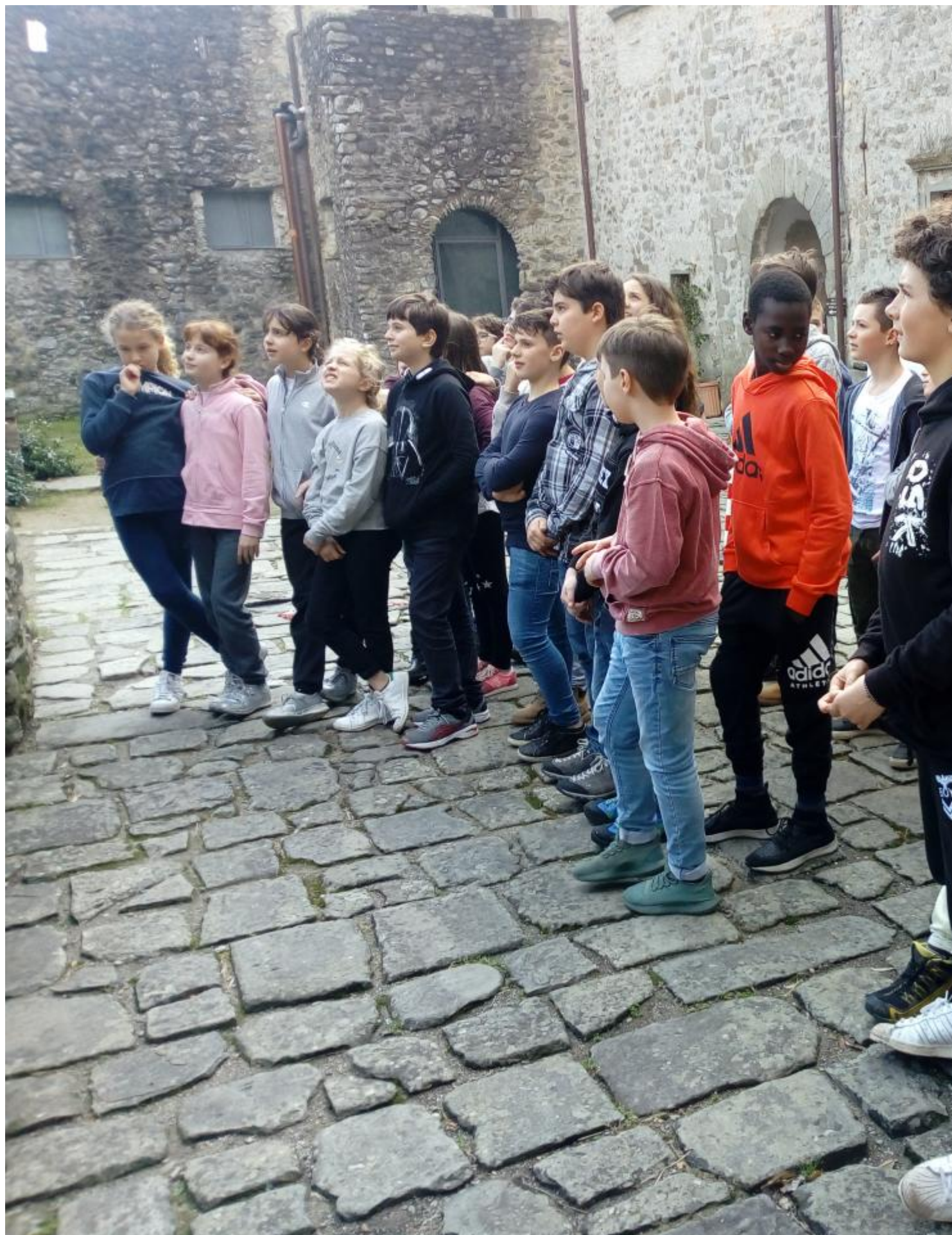
Stamani le classi I A e I C del plesso Malaspina hanno visitato il castello del Piagnaro e il