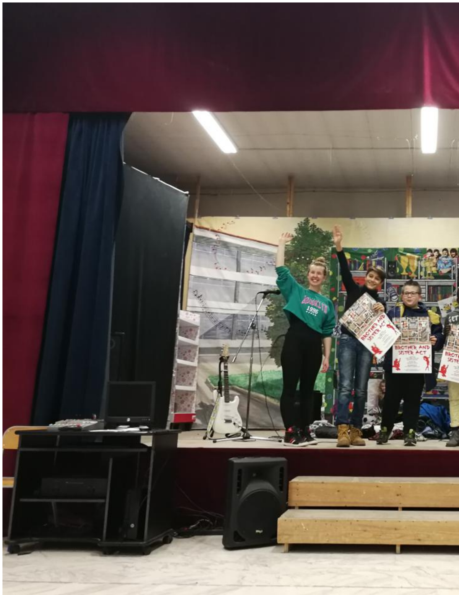
Anche quest'anno, come ogni anno, la nostra scuola ha ospitato la compagnia teatrale Action Theatre