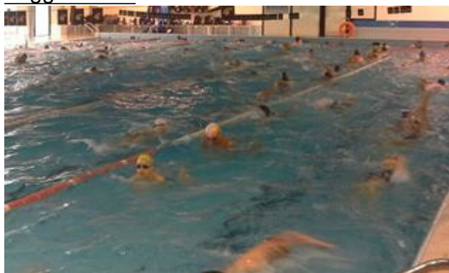
Cascata di medaglie per gli alunni della Malaspina

Staffetti che il 14 marzo hanno partecipato alle Finali dei Campionati Interprovinciali di Nuoto presso la Piscina Comunale di Massa.