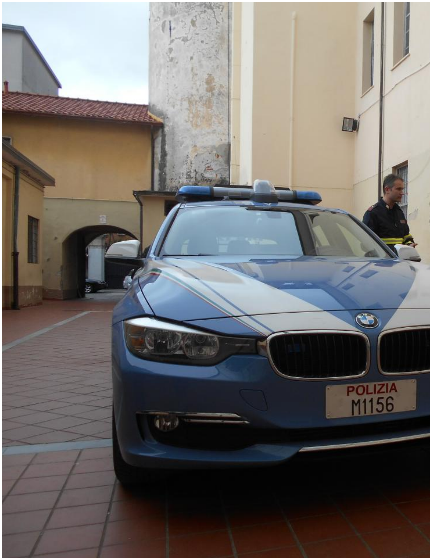
La comandante della Polizia Stradale della provincia di Massa-Carrara accompagnata da un agente della Polizia Stradale