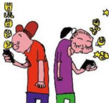
CONNESSI I ragazzi mentre messaggiano (disegno di Luca Fruzzetti)

LA STRAGRANDE maggioranza degli alunni della nostra scuola possiede un cellulare e non ne può fare a meno. Molti lo usano da 1 e 3 ore al giorno e lo consultano anche di notte. Questo è quanto emerso da un questionario sull'utilizzo del telefonino che abbiamo somministrato a 215 nostri compagni delle classi prime, seconde e terze. Non si può parlare di dipendenza, ma certamente c'è un forte legame con il cellulare. Dai risultati è saltato agli occhi che quasi tutti gli alunni della scuola possiedono un cellulare (88%) e quasi la metà di loro (40%) lo consulta anche di notte. In un giorno la maggioranza degli alunni lo adopera tra una e due ore (33%) e fino a tre ore (22%). Un dato che ci fa riflettere è il 15% degli studenti che lo utilizza per più di quattro ore. A una domanda a scelta multipla è emerso che il 68% degli studenti usa il telefonino per il suo scopo primario, ovvero contattare le persone, mentre per il resto il cellulare è usato per navigare su internet