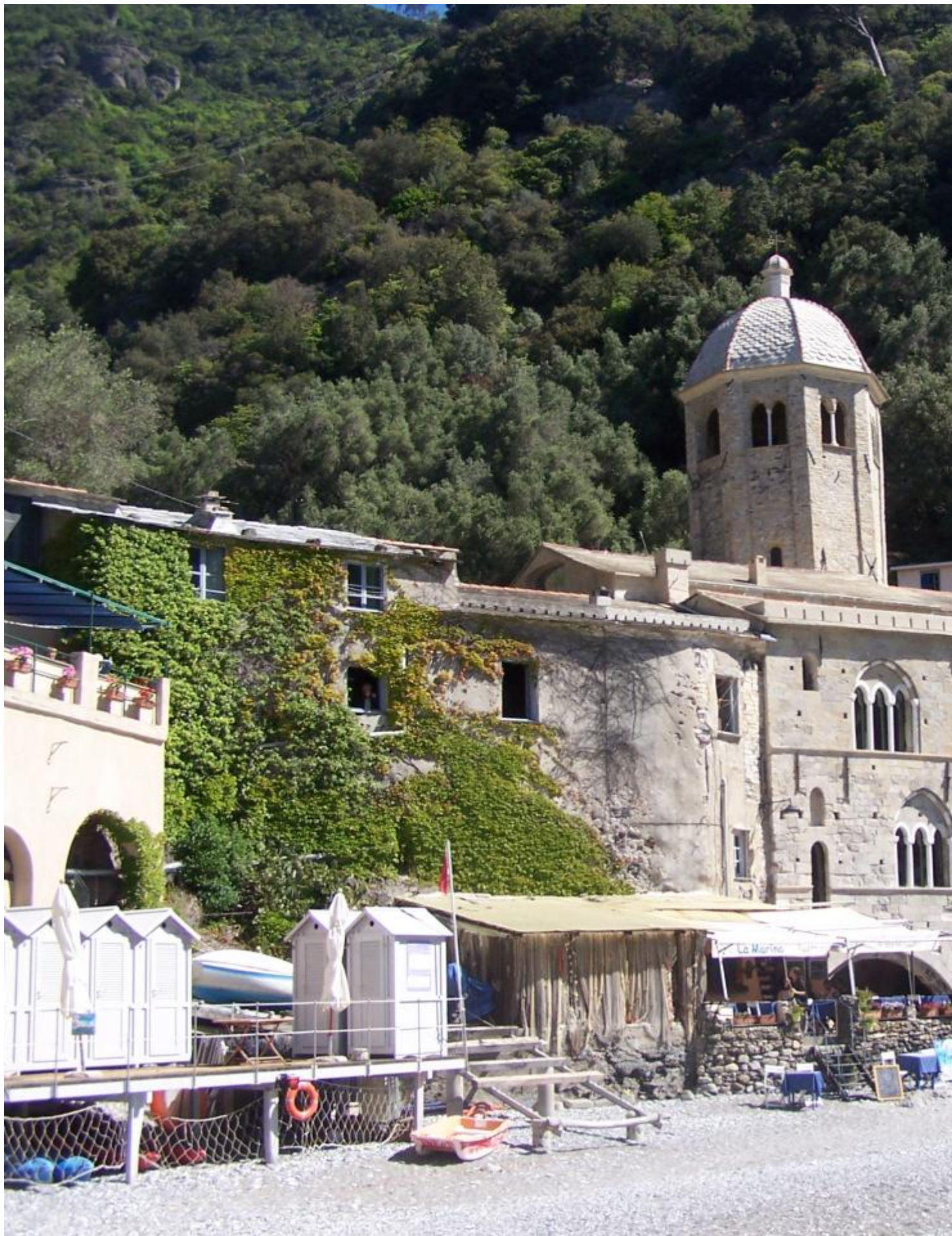
Quattro splendide località della riviera ligure di levante sono state oggi la meta della gita che ha