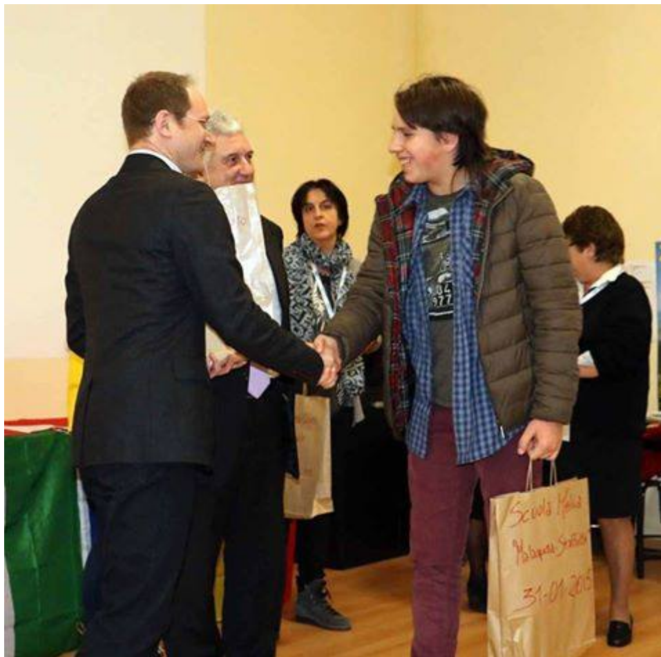
Sabato 31 gennaio e

sabato 7 febbraio, presso l'istituto Zaccagna di Carrara, è stata disputata la prima edizione dei Giochi della Geografia . Centinaia di studenti delle province di Massa-Carrara e della Spezia si sono confrontati, sia individualmente che a squadre, nella soluzione di giochi geografici al computer riguardanti elementi naturali, città e Stati dell'Europa e del mondo e nella costruzione di puzzle geografici.