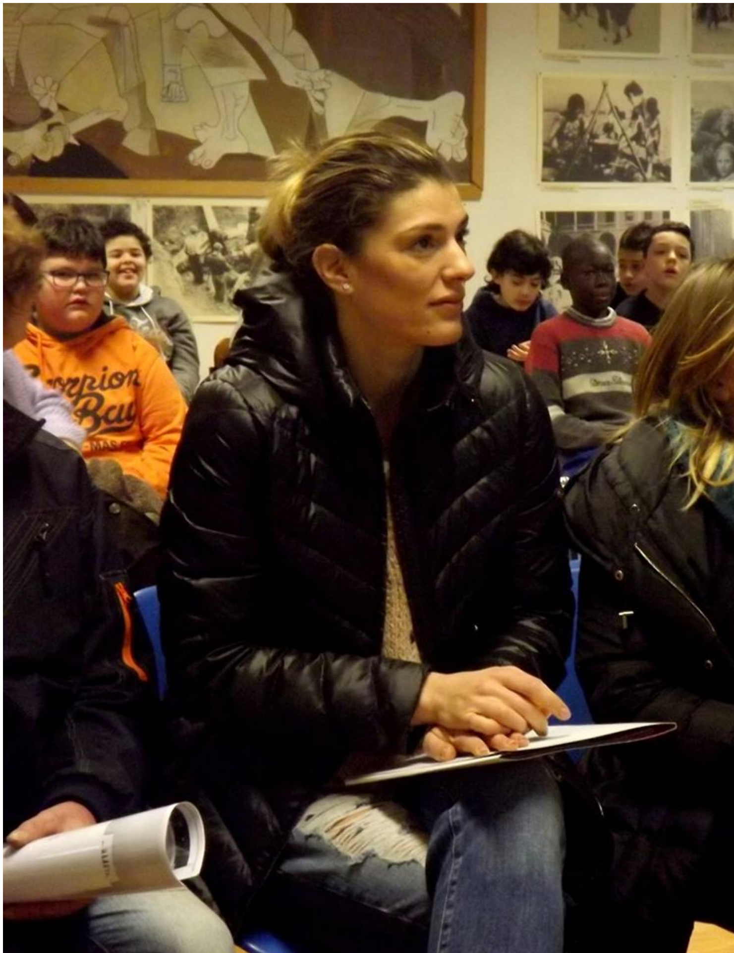
Staffetta di "eroi" stamani nei due plessi della nostra scuola secondaria.