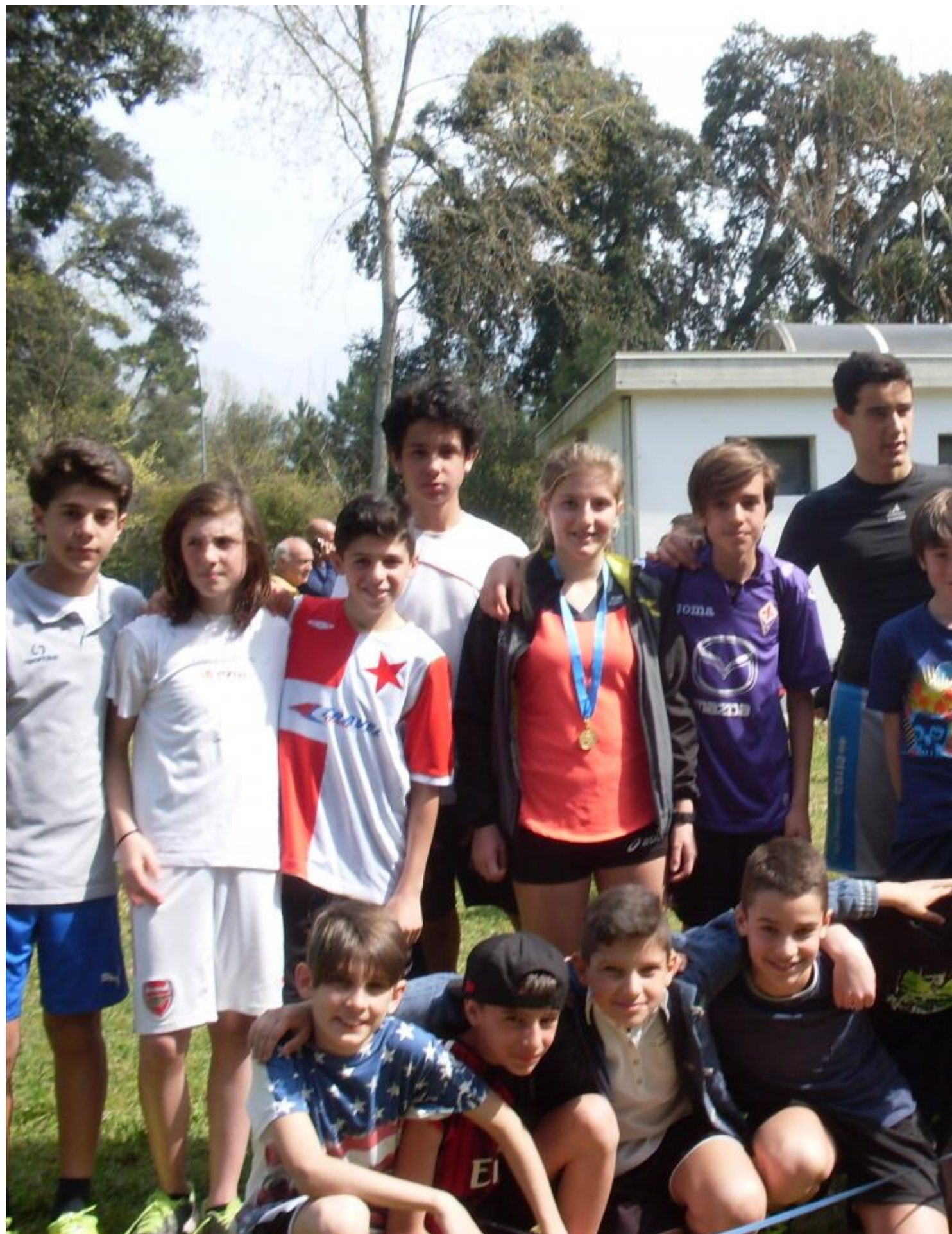
Ottimi risultati degli studenti che hanno rappresentato il nostro Istituto nei Campionati Provinciali di Corsa Campestre