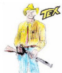
HITO Made Gabriele Cantoni

COME passano il loro tempo libero i nostri concittadini? Quali fumetti leggono? Con quali videogiochi trascorrono il loro tempo libero? Per avere le risposte abbiamo intervistato alcuni edicolanti e alcuni negozianti del centro della città. Parlando con il giovane esercente di «Comics World», un angolo di cultura nerd in via Cavour, è emerso che il manga (i fumetti giapponesi) vanno a ruba tra chi ha meno di trent'anni: un albo che racconta la storia dei pirati alla ricerca del favoloso tesoro che prende il nome di "One Piece" vende ad ogni uscita in media sessanta copie, mentre le avventure del ninja "Naruto" si attestano su circa cinquanta e le storie degli shingiani della serie "Bleach" arrivano a circa trenta copie. Secondo gli edicolanti di via Guidoni e di piazza Gagliardini, l'unico fumetto