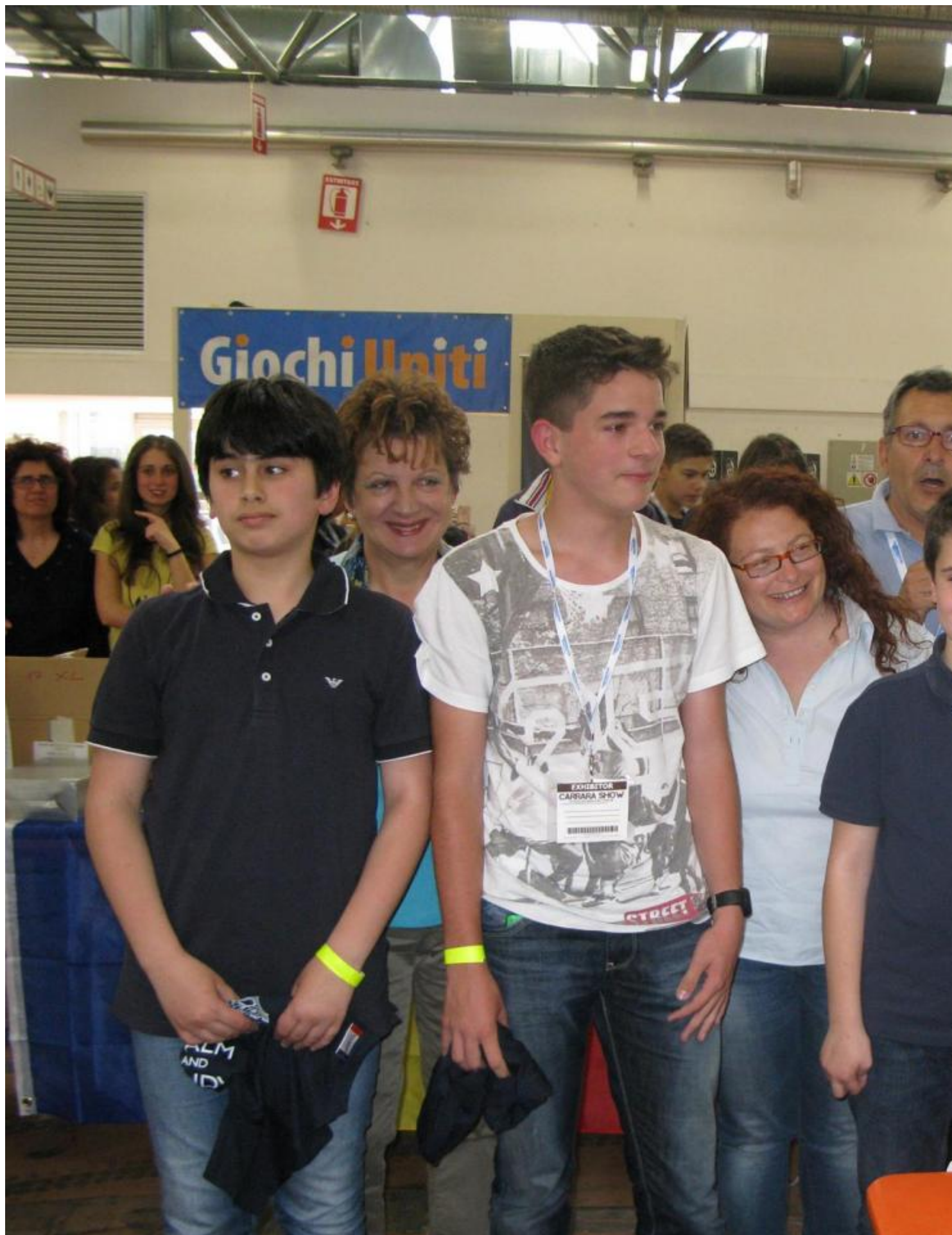
Oggi pomeriggio la rappresentativa della nostra scuola si è aggiudicata l'edizione speciale