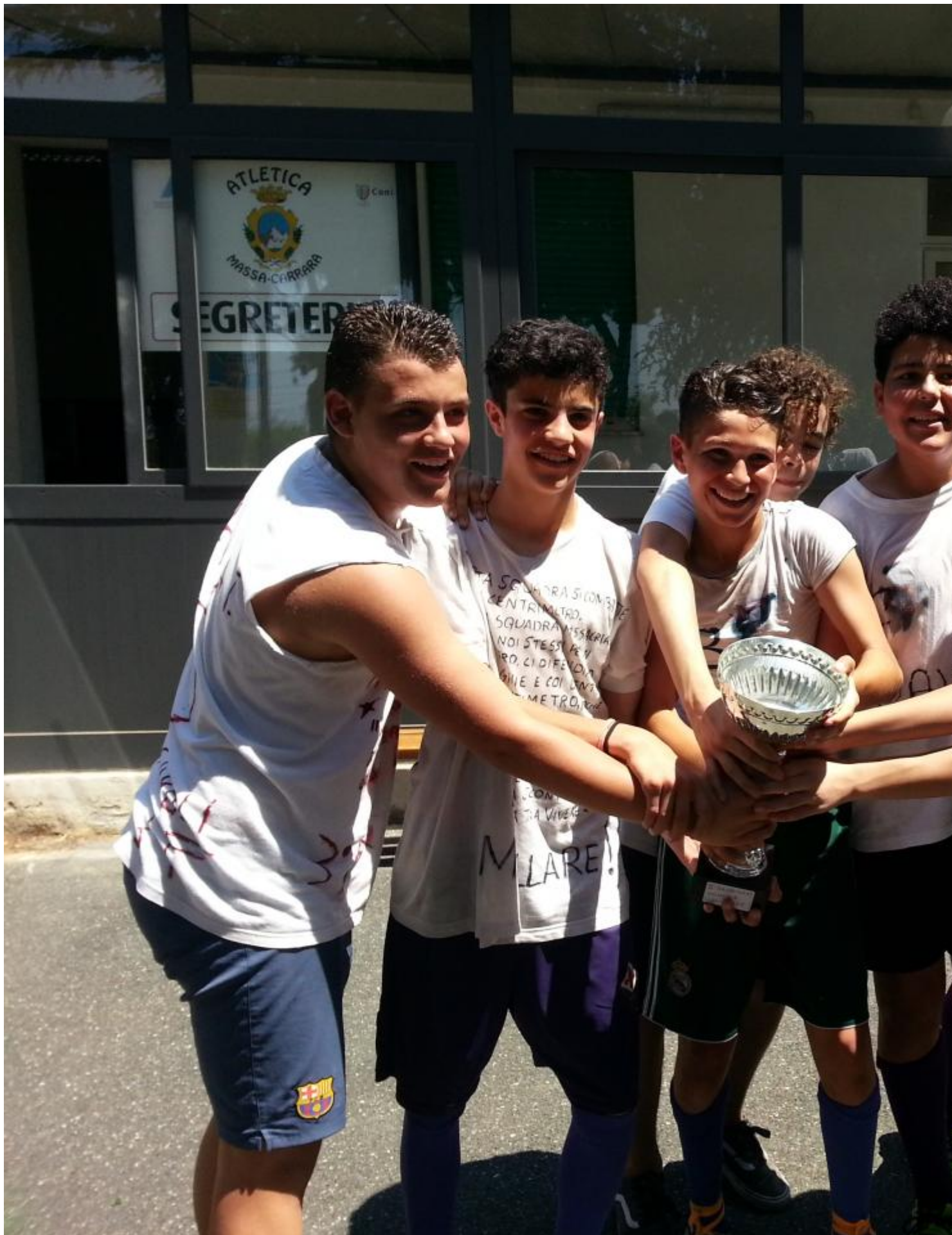
Stamani, presso l'impianto di via Oliveti, si è svolto il IV trofeo UNVS Massa (Unione