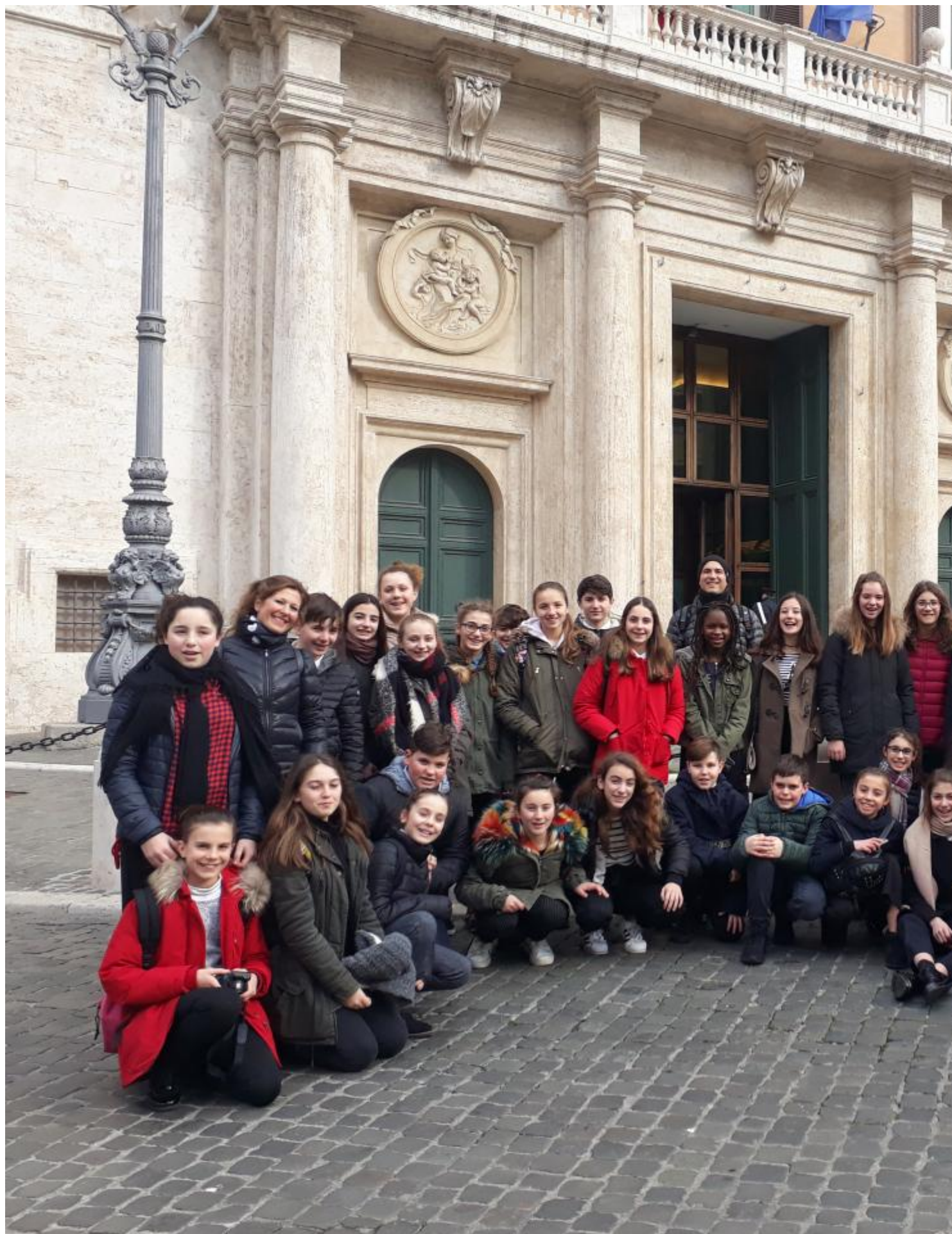
Le classi II A e II B della Malaspina hanno inaugurato i viaggi di istruzione per l'anno 2018 con una meta insuperabile: Roma