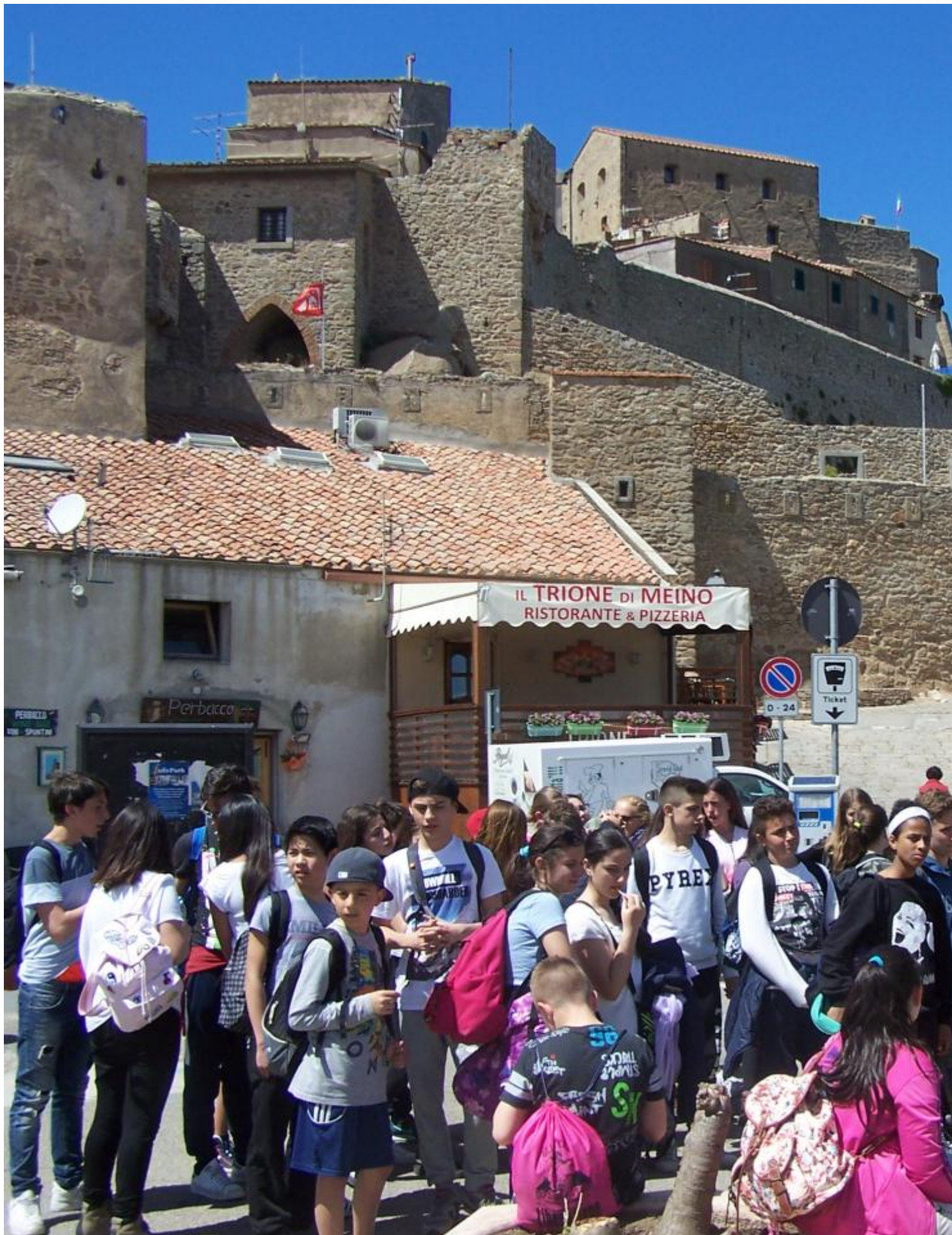
Sono rientrati stasera, dopo tre intense giornate trascorse nel Sud della Toscana, le studentesse e gli studenti delle classi II C e II E del plesso Malaspina , accompagnati dai loro